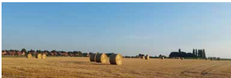
L'été est aussi la période des moissons