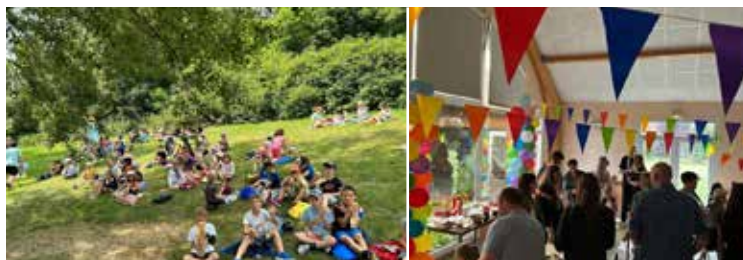
Centre de loisirs - activité de juillet