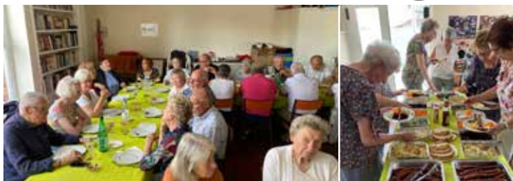
13 juillet : Barbecue des aînés - CCAS