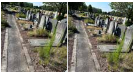
Nettoyage du cimetière par les élus