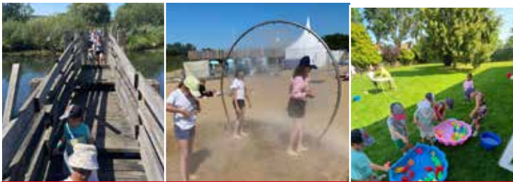
Centre de loisirs - activité d'août