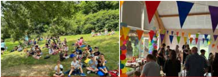
Centre de loisirs - activité de juillet