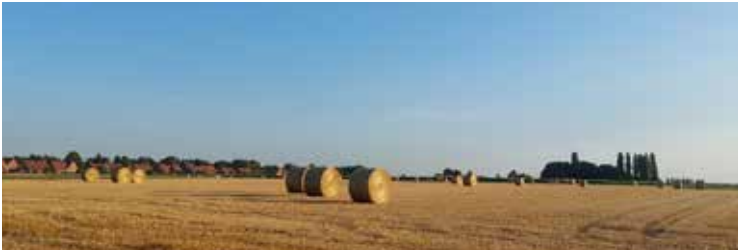
L'été est aussi la période des moissons