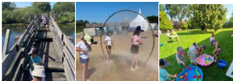
Centre de loisirs - activité d'août