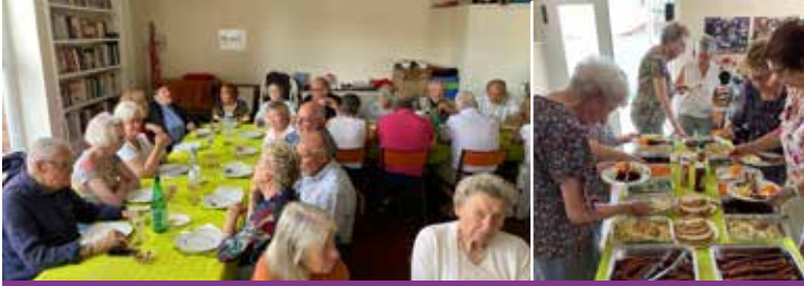
13 juillet : Barbecue des aînés - CCAS