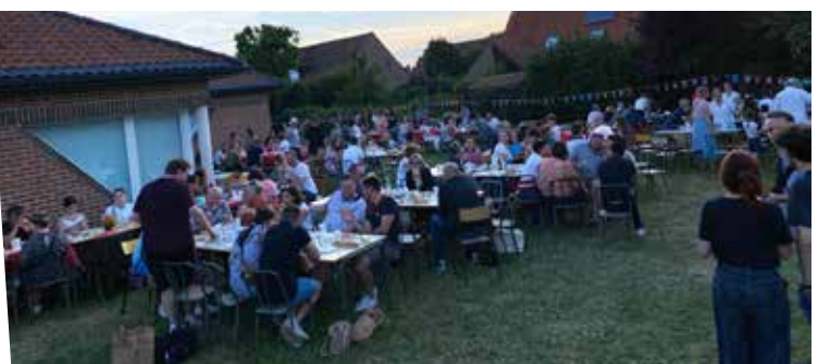
23 juin : Kermesse APE