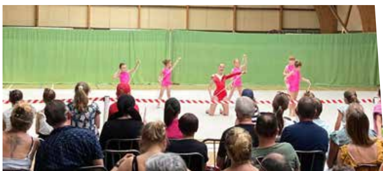
11 juin - Démonstration lors des portes ouvertes - GRS