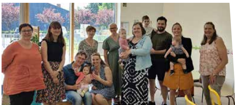
3 juin : Accueil des petits saillysiens nés en 2022 - CCAS