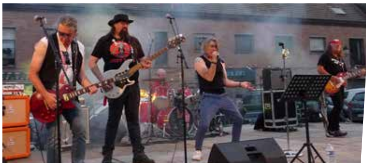
17 juin : Les Rock'agénaire à la fête de la musique