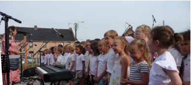
17 juin : Chant des élèves de l'école maternelle