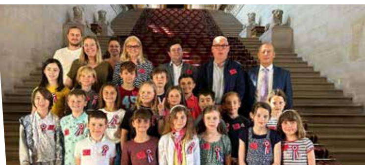
7 juin : Le CME en visite au sénat - Ecole Jeunesse