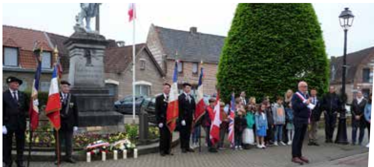
8 mai : Commémoration armistice 1945