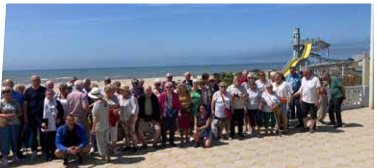
21 juin : Voyage à Etaples - Le Touquet pour les aînés - CCAS