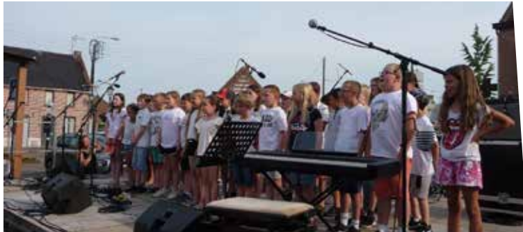
17 juin : Chant des élèves de l'école élémentaire