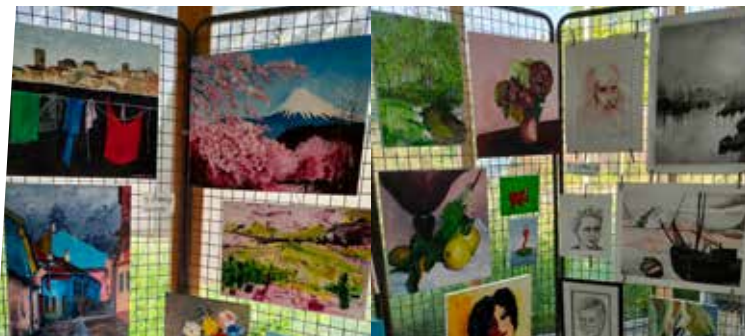
17 mai : Exposition Madeleine Lamarche - Bibliothèque