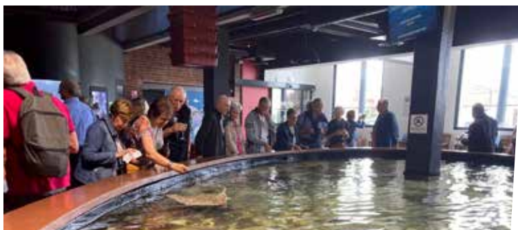
21 juin : Visite de Maréis pour les aînés - CCAS