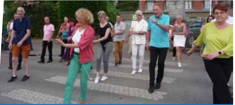
17 juin : Cadanse à la fête de la musique