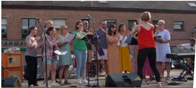
17 juin : Chorale de la SACHEM à la fête de la musique