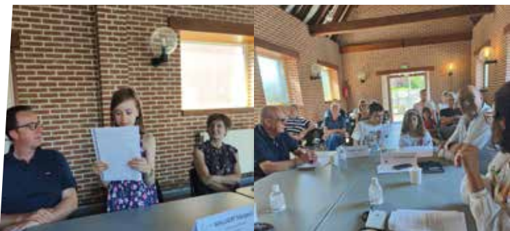
10 juin : Le Conseil Municipal accueille le CME