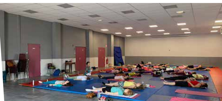
11 juin : Découverte du yoga et du pilate - Escal