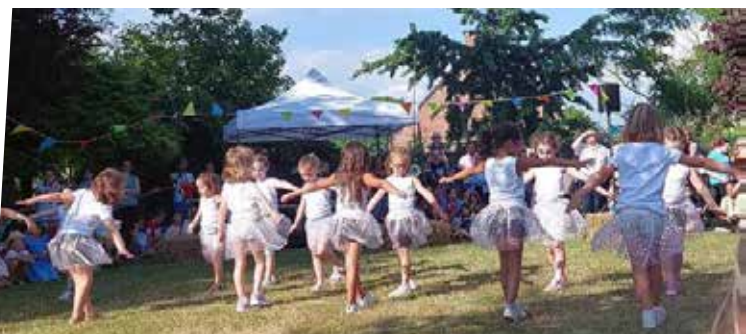
23 juin : Fête des écoles - École Jeunesse