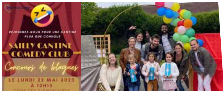
22 mai : Concours de blagues au Saily Cantine Comedy Club - Ecole Jeunesse