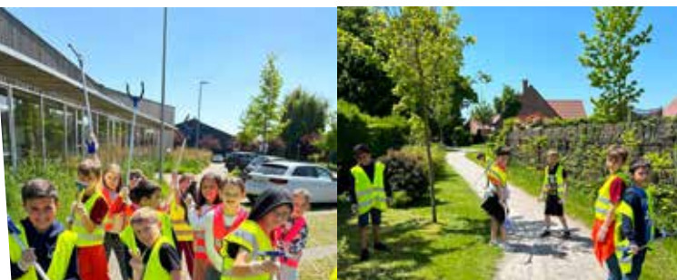
26 mai : Le Conseil Municipal des Enfants nettoie le village - Ecole Jeunesse