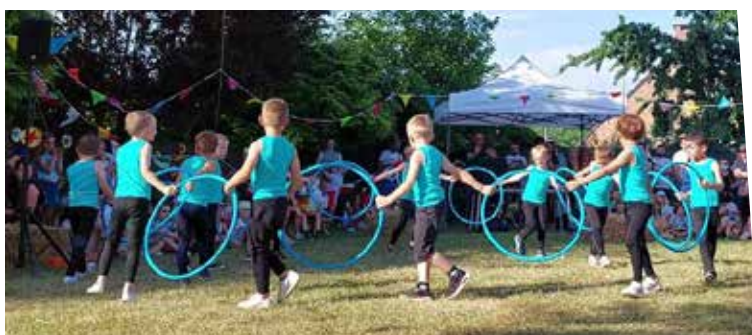
23 juin : Fête des écoles - École Jeunesse