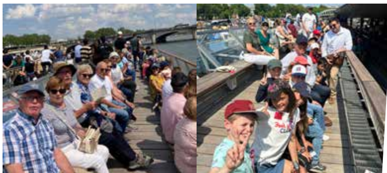
7 juin : Visite de Paris intergénérationnelle